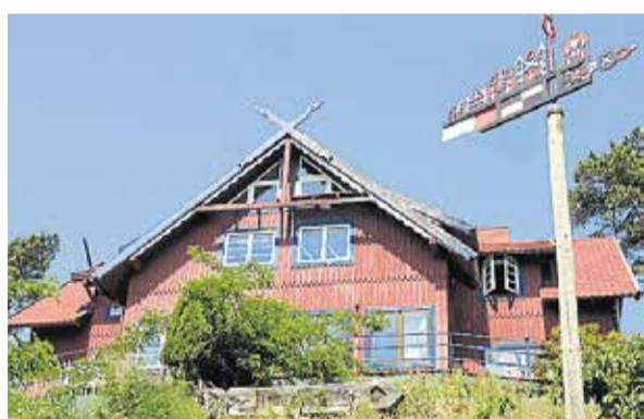
Typisk Nida-arkitektur i rødt, blåt og hvidt. Byen er kendt for sine mange vejrhane. Dem skulle alle fiskere før have på deres både, så myndighederne kunne kende dem.

de vejen forbi Parnidis i 1965. Det var den franske filosof Jean-Paul Sartre, der sammen med Simone de Beauvoir var på besøg i Sovjetunionen, og i den forbindelse kom hertil fra Kaliningrad. Han blev så betaget af områdets skønhed, at han beskrev oplevelsen "som at stå ved himlens port". For et par år siden rejste kommunen en statue af Sartre nær soluret. Bronzefiguren kæmper sig frem over klitten i strid mod vind.