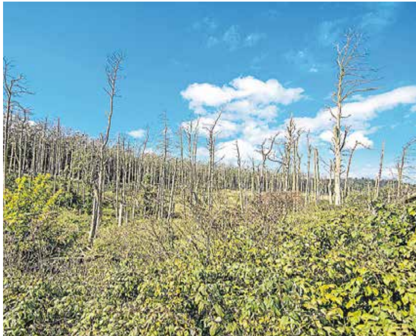
Skarverne har ødelagt adskillige træer udenfor Juodkrante. Men de tiltrækker mange turister - 65.000 per år!

Vi vandrer langs strandpromenaden i Nida og beundrer de mange vejrhane, som har deres egen historie. I 1844 besluttede myndighederne, at alle fiskeskibe skulle have en vejrhane på masten, så man kunne kende dem igen og kontrollere fiskeriet. Hver by fik deres egen farve og symbol. I årenes løb har erhvervsfiskerne forfinet