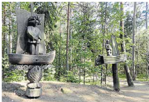
Litauen er kendt for sin træskærerkunst. I Juodkrante ligger Heksesnes høj med 80 store træskulpturer, der forestiller figurer fra litauiske legender og sagaer.