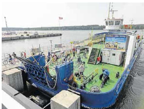
Færgen mellem Klaipeda og Smiltynė varer kun fem minutter. Den er fyldt med cyklister og fodgængere.