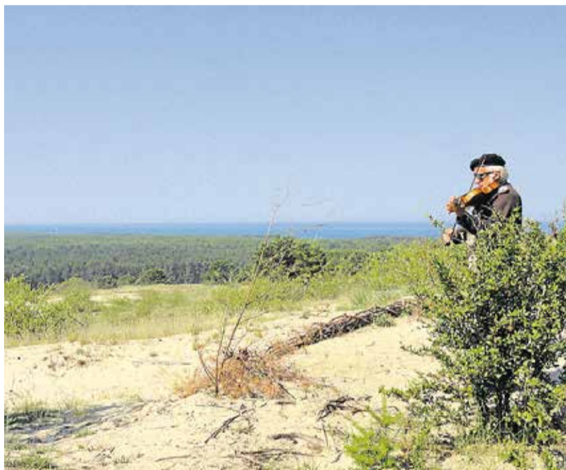
En pensioneret, professionel orkestermusiker kommer jævnligt til soluret og spiller - bare sådan.